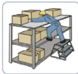
自分の動作の反動で墜落

墜落・転落災害は、滑って、踏み外して、自分の動作の反動でつまずいたり原因で事故は発生します。冬季特有の天候や寒さなど作業環境の悪化による災害も発生しますので、気をつけましょう。