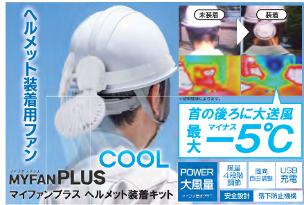
マイファンプラスヘルメット装着キット No.45376 定価5,478円