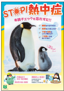
安全衛生ポスター STOP!熱中症 No.31813 B2判 定価297円