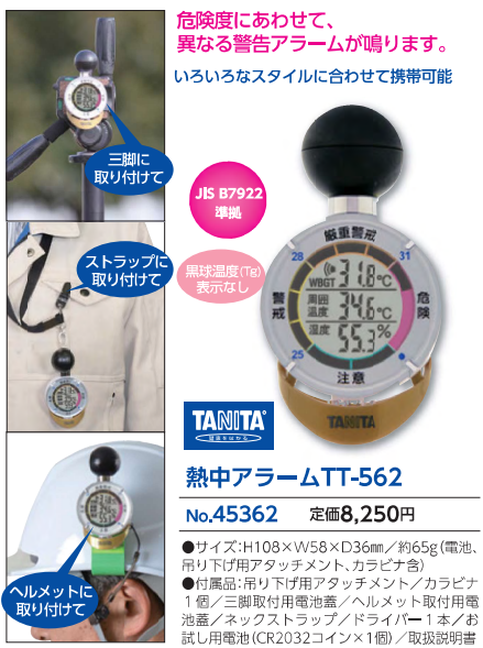
危険度にあわせて、異なる警告アラームが鳴ります。いろいろなスタイルに合わせて携帯可能 JIS B7922準拠 黒球温度(T g )表示なし 熱中アラームTT-562 No.45362 定価8,250円 ●サイズ:H108×W58×D36mm / 約65g(電池、吊り下げ用アタッチメント、カラビナ含) ●付属品:吊り下げ用アタッチメント/カラビナ1個/三脚取付用電池蓋/ヘルメット取付用電池蓋/ネックストラップ/ドライバー1本/お試し用電池(CR2032コイン×1個)/取扱説明書