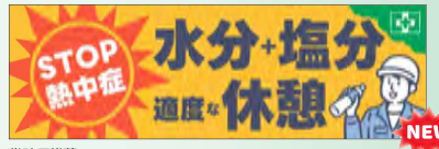
常時用横幕 STOP!熱中症 No.44913 定価 2,750円 ●サイズ:H0.7×W2.14m ●材質:綿