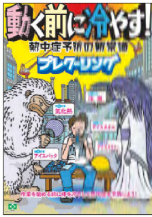
安全衛生ポスター 熱中症・プレクーリング No.31843 B2判 定価297円