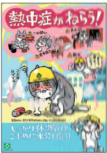
安全衛生ポスター 熱中症がねらう・仕事猫 No.31869 B2判 定価297円