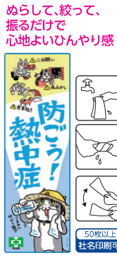
クールタオル(仕事猫) No.45055 定価 880円 ●サイズ:H900×W300mm ●材質:ポリエステル ●PP袋入