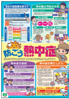
実践ポスター 防ごう熱中症 No.31510 B2判 定価418円