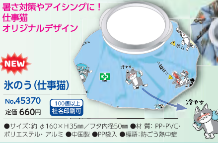
暑さ対策やアイシングに! 仕事猫 オリジナルデザイン NEW 氷のう(仕事猫) No.45370 定価 660円 ●サイズ:約 φ160×H35mm / フタ内径50mm ●材質:PP・PVC・ポリエステル・アルミ ●中国製 ●PP袋入 ●喋語:防ごう熱中症

※季節商品のため数に限りがございます。ご注文後に欠品のご連絡を差し上げる場合がございます。