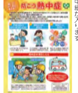
中紙が入ります ※熱中症予防のポイントをとめた