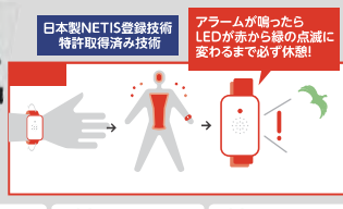
熱中対策ウォッチ カナリアPlus™ No.45379 定価5,940円 NEW ●サイズ:H13×W27×D43mm / 20g ●材質:(筐体)ABS (ベルト部分)シリコン ※バッテリー寿命:ワンシーズン(5ヶ月)