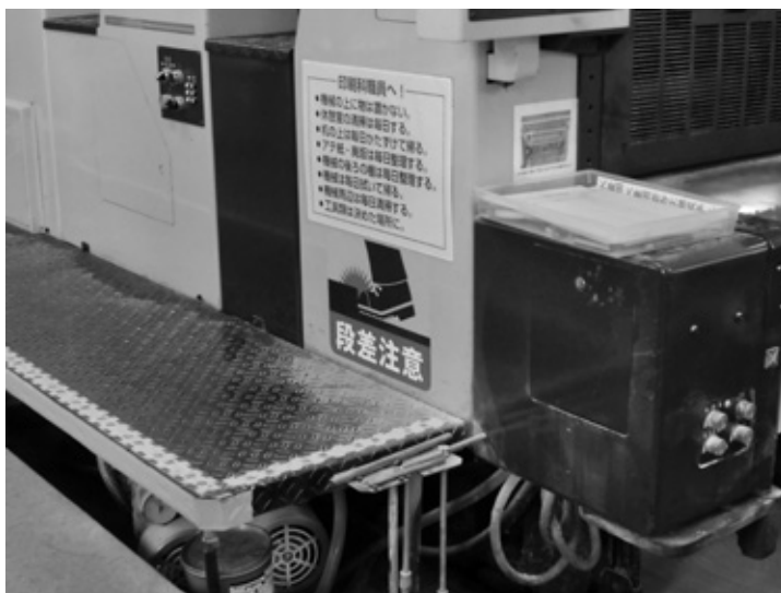
写真2 大きな「段差注意」の表示で注意喚起（利用者が使う印刷機）

具体的には、以前から壁に5Sの定義（写真3、94頁）は掲げていたもののあまり定着していなかったが、活動を本格化