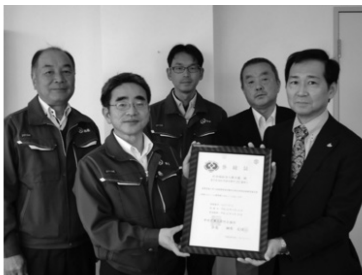
写真1 登録認定証の授与