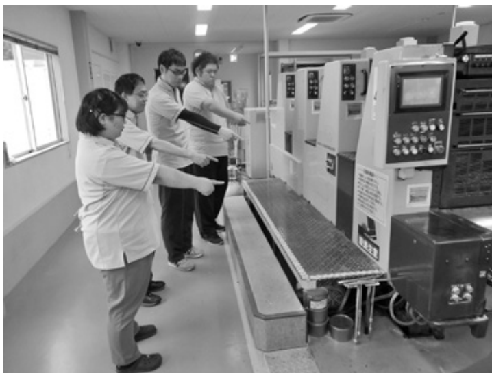
写真5 印刷機の使用時に指差し呼称

同法人の理念である、「私たちは報恩感謝の心を持って 福祉の支援を必要とする人々に 希望の明かりを灯し続けます」の下、職員が一人も欠けることなく、「利用者が普通に利用して、帰るのが普通」であり続けることを願う。(中災防中国四国安全衛生サービスセンター)