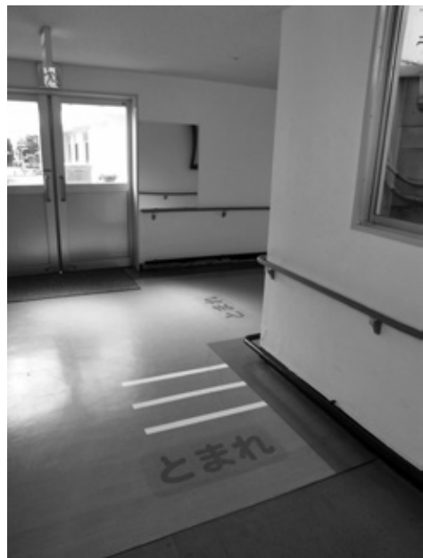
写真4 「とまれ」の表示