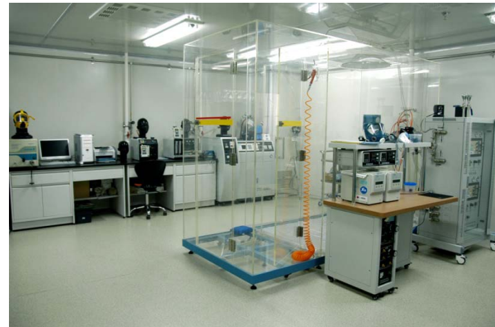
个体防护用品检测与评价