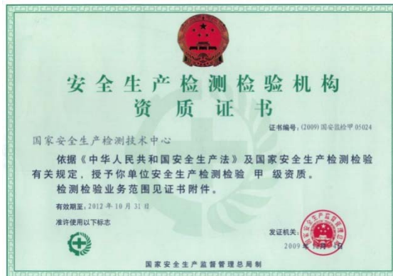
安全生产检测检验机构资质证书