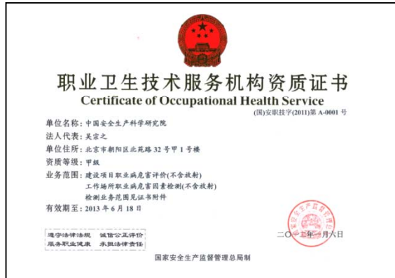
技术服务机构证书