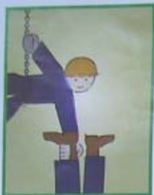
PHẢI DÙNG DÂY AN TOÀN KHI LÀM VIỆC TRÊN CAO