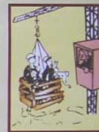
CÁM CHỖ NGƯỜI LÊN CAO BẮC CÁN TRỰC