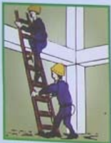
NẾU CHÂN TRANG KHÔNG VỮNG CHẮC, PHẢI CÓ NGƯỜI ĐỖ CHÂN TRANG