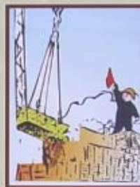
PHẢI NHẢY HANG LÊN CAO TỐI THIỂU 0,5 m TRÊN CÁC VẬT CỨ, TRƯỚC KHI CHUYỂN HANG THEO PHƯƠNG NGANG