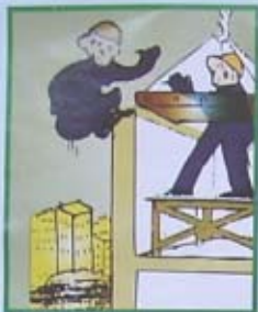
CÁM ĐUNG TRÊN ĐỈNH PANEN TƯỜNG KHI LẮP CHÉP