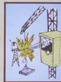
PHẢI ĐẢM BẢO KHOẢNG CÁCH AN TOÀN BÊN BỜNG DÂY TẢI ĐIỆN TRÊN KHÔNG