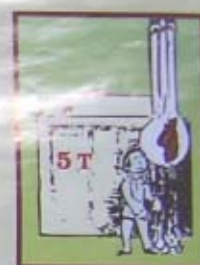
PHẢI SỬ DỤNG DÂY CÁP PHÙ HỢP VỚI TẢI TRỌNG