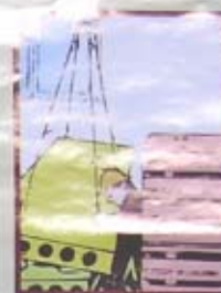
CÁM ĐUNG GIỮA 2 CHỖNG PANEN KHI MỐC CẦU