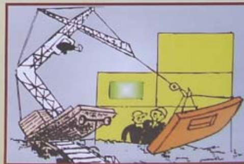
CÁM CỨ HANG KHI Kéo KIẾN DÂY CÁP

TRANG TUYẾN TRUYỀN TUYÊN LỆ QUỐC GIA VỀ AN TOÀN VỆ SINH LAO ĐỘNG - PHÒNG CHỐNG CHÁY BỎ