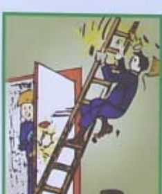
CHÚ Ý KHI BẮC TRANG Ở CỬA RA VÀO, NƠI CÓ NHIỀU NGƯỜI QUA LẠI

TRANG TUYẾN TRUYỀN TUYÊN LỆ QUỐC GIA VỀ AN TOÀN VỆ SINH LAO ĐỘNG - PHÒNG CHỐNG CHÁY BỎ