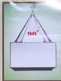
GÓC GIỮA CÁC NHÁNH DÂY TREO KHÔNG NÊN QUÁ 90°