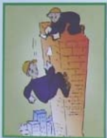
CÁM NGỒI XÂY TRÊN ĐỈNH TƯỜNG