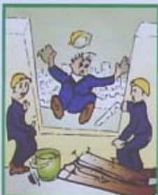
PHẢI CHÉ CHÁN LỖ CỦA TƯỜNG NGOÀI ĐỂ PHÒNG NGÃ TỪ TRÊN CAO