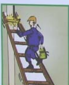
PHẢI TÌ BÀI CỘT TRANG VÀO ĐIỂM TỰA, KHÔNG TÌ BẮC SẮC TRANG