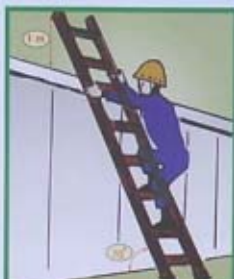
PHẢI BẮC TRANG ĐUNG ĐỘ NGHIÊNG (70°) ĐẦU TRANG NHỎ KHỐI ĐIỂM TỶ 1m