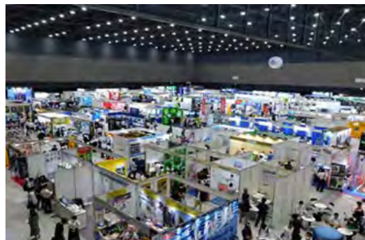
緑十字展 展示会場

安全衛生保護具、機械の本質安全化にかかる機器、職場環境・作業方法の改善機器、健康増進機器等の展示や装着体験セミナー等を通じて、職場の安全衛生を普及・促進し、労働災害の防止、働く人の心身両面にわたって健康で快適な職場環境づくりに関する安全と健康の最新情報と技術をご紹介するわが国最大級の展示会である。