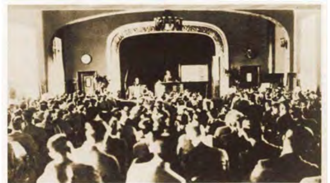
盛況な第1回全国産業安全大会（昭和7年11月・東京・学士会館）

それは、「人間とは何か」にメスを入れ、人間の持つ弱点をカバーする方策に取り組もうとする科学的姿勢が、企業の中に生まれつつあることを示したものだ。