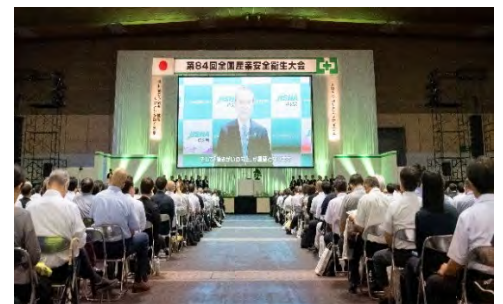
全国産業安全衛生大会・総合集会

今回、札幌での現地開催は2008(平成20)年以来18年ぶりとなるが、安全衛生管理や健康づくり等に関する最新かつ関心の高いテーマに加え、北海道ならではの産業(農業、畜産業、食料品製造業、食品加工業等)に着目した労働災害防止についてのプログラムを提供することとしている。