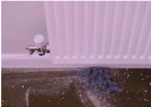
Loose-fill blue asbestos in wall cavity drilled out whilst fitting a radiator