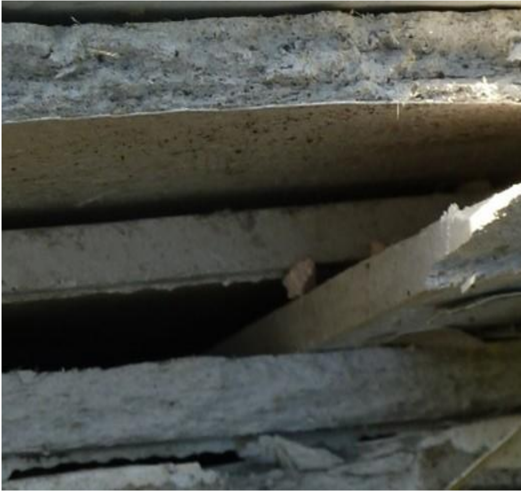
Loose-fill asbestos (ゆるく貼り付けられたアスベスト)