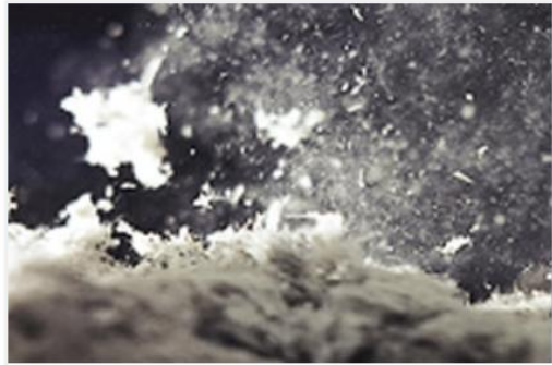
Release of loose-fill asbestos fibres