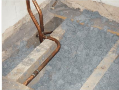
Loose-fill blue asbestos under floorboards