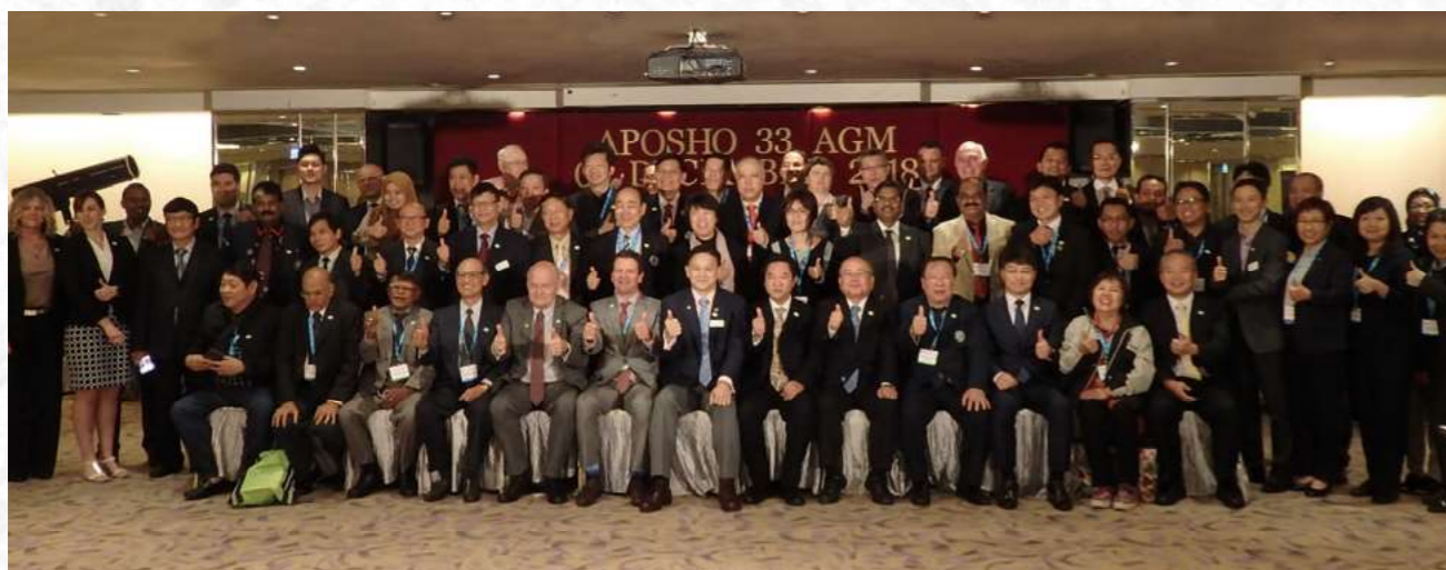
APOSHOには、日本から中央労働災害防止協会(JISHA)が加盟しています。(正会員29団体 準会員2団体 関係団体8団体)

APOSHO年次総会は、各国の団体の持ち回りで毎年開催されており、日本での開催は、1988年(第4回)及び1989年(第5回)から実に32年ぶりの開催となります。日本では今回の第35回「アジア太平洋労働安全衛生機構年次総会」をより多くの方に安心してご参加いただくよう、名称を「アジア太平洋安全衛生大会」(APOSHO35)としてオンラインで開催いたします。