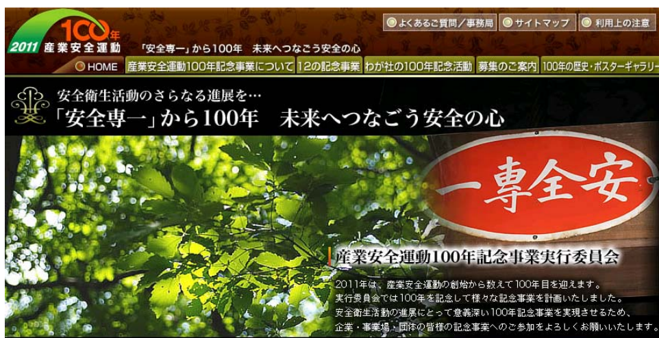
産業安全運動100年記念サイト

また、記念図書の発刊、中災防月刊誌・安全と健康、安全衛生のひろばへの連載・特集等の情報を随時、更新しました。