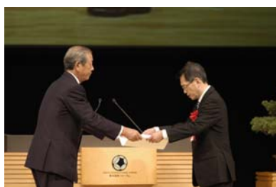
金賞受賞者の表彰式の様子

金賞、銀賞受賞作品は、中災防発行の月刊誌「安全と健康」11月号及び産業安全運動100年記念サイトに掲載しました。