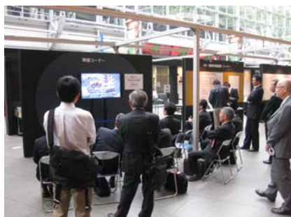
記念展示における記録映像上映の様子

この映像は、産業安全運動100年記念「第70回全国産業安全衛生大会」総合集会及び産業安全運動100年記念展示にて上映し、大変な好評を得ました。