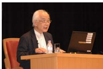
柳田邦男氏（ノンフィクション作家）