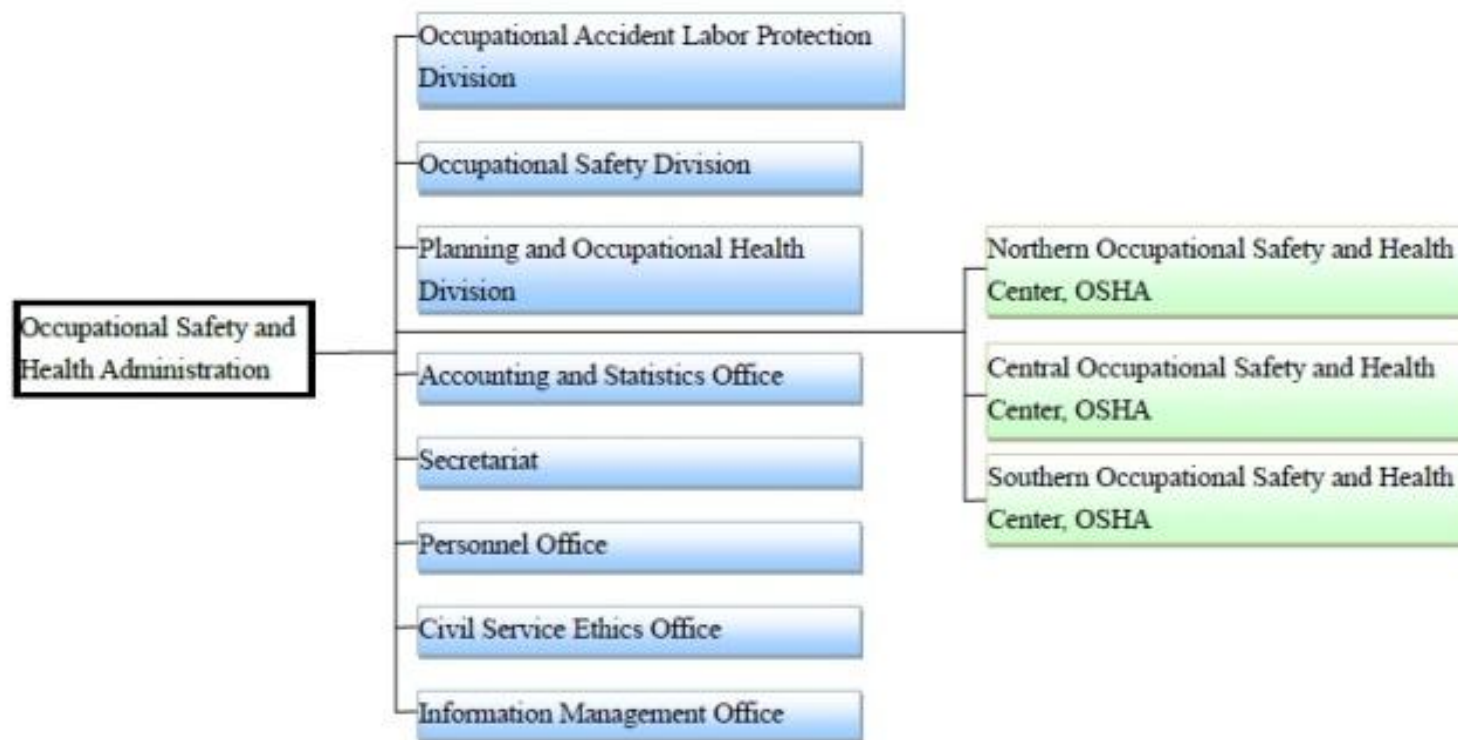
図2 職業安全衛生部 (Website: http://www.osha.gov.tw/enhome/ ) の組織図 (作成者注: 2019年3月29日に、台湾の労働安全衛生部のHP: https://english.mol.gov.tw/6386/6427/6432/6525/ にアクセスして得られた組織図を引用した)。

この組織図にあるとおり、職業安全衛生部の内部部局として、8課ないし室が、地方機関として3つの職業安全衛生センターがある。