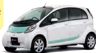
三菱自動車 i-MiEV ▶