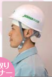
汗取り インナー キャップ